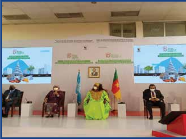
Journée mondiale de l'urbanisme Fevrier 2023

Régisseur événementiel, EasyGroup est une agence de marketing événementiel, bâtie sur 4 corps de métiers à savoir le développement de marque, les rencontres institutionnelles, la création de contenu audio-visuel, les technologie de divertissement.