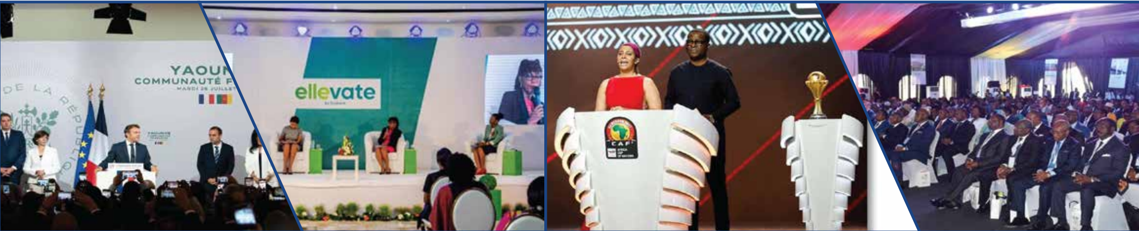
Visite de M. Emmanuel MACRON Juillet 2022

EasyGroup c'est plus de 3000 déploiement événementiel, plus de 1000 activations de marques, plus de 1000 réalisations audio-visuelles, et plus de 250 rencontres institutionnelles.